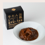
ごろっと牛タンのデミグラスソース煮込み ¥900(税込)