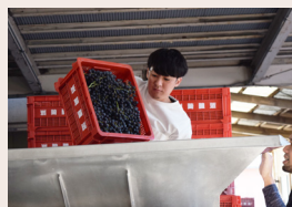
ぶどうから枝をとり、実だけにする「除梗」作業