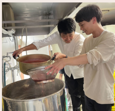
フレッシュないちごペーストの濾過作業

KURANDでは、福利厚生制度として酒蔵で酒造りを体験する「KURA修行」があります。醸造シーズン真っただ中の今月は2つの酒蔵でのKURA修行が実施されたため、その様子をお届けします。 茨城県の「結城麦酒」でクラフトビール造りに挑戦 まずお邪魔したのは茨城県結城市にある「結城麦酒」。クランドの各種ビールを醸造しています。 スタッフ5名で訪問し、いちこのフレーバービールの醸造現場に立ち会いました。鍋の攪拌、濾過作業、瓶詰め、ラ