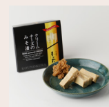
クリームチーズのみそ漬 ¥648(税込)