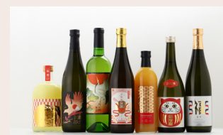
福袋に合わせて登場した新商品（一部）

さらに購入時期が早いほどお得になる早期特典付きプランや遊び要素を設けた数日限定のフラッシュプランなども多数展開。 福袋を購入した人の中から抽選で、豪華お酒セットが当たることも。華やかなお酒たちと優雅に過ごす年末年始をクランドがお手伝いします。