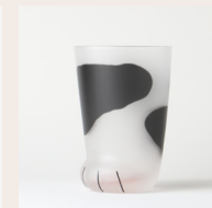
写真② ねこ足グラス/ブチ