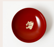
写真① 瓶を持つくにとん/平盃