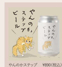
やんのかステップ ¥890(税込)